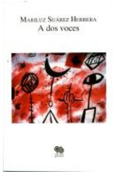
A dos voces (Editorial Praxis; México, 2004)