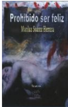
Prohibido ser feliz (Eterno Femenino Ediciones; México, octubre 2011)